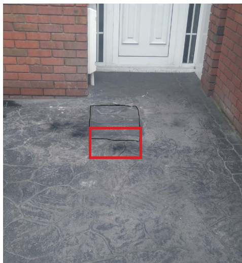
Reconstitution temporaire sur béton matricé.

Si les zones de pelouse sont endommagées quand on fait la tranchée, notre équipe s'efforcera de les réparer, même de ressemer si nécessaire. La remise en état des platebandes et de la pelouse peut être retardée selon les conditions météo.