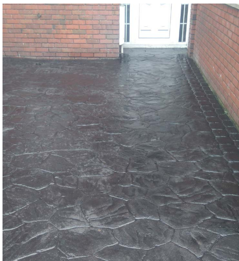
Reconstitution permanente sur béton matricé.