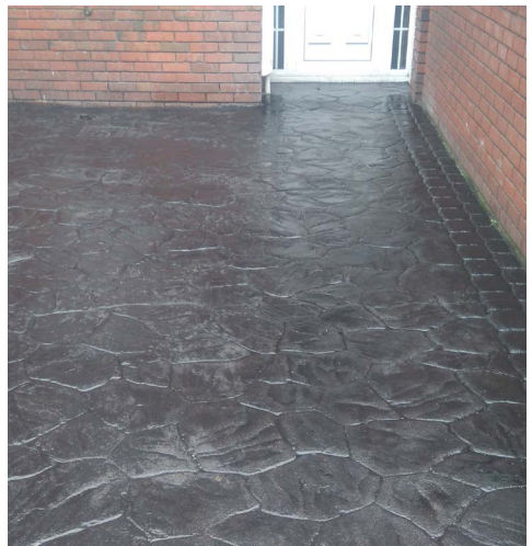
Aischur buan ar choincreít phriontáilte.