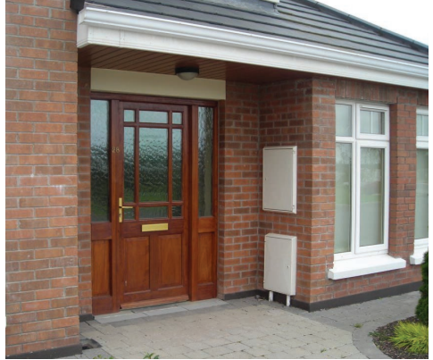
Sampla de bhosca méadair i limistéar ar féidir é a bheith iata.

Ní ghearrfar aon chostas ort as an obair a chuirfear i gcrích. Tabhair faoi deara, áfach, go mbeidh de thoradh ar an obair dícheangal sealadach do sholáthair gháis.