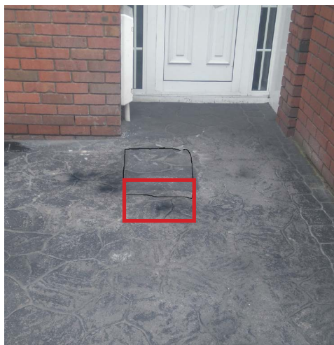
Tymczasowe odtworzenie na betonie drukowanym.

Trawniki także będą traktowane z należytą starannością, jednak możliwe, że nie da się uniknąć wejścia na trawnik lub pobocze, zwłaszcza w przypadku gorszej pogody. Jeśli trawniki zostaną naruszone w trakcie wykonywania wykopów, nasza ekipa podejmie próbę ich naprawienia, łącznie z ponownym obsianiem. Naprawy klombów i trawników mogą się przedłużyć ze względu na czynniki sezonowe.