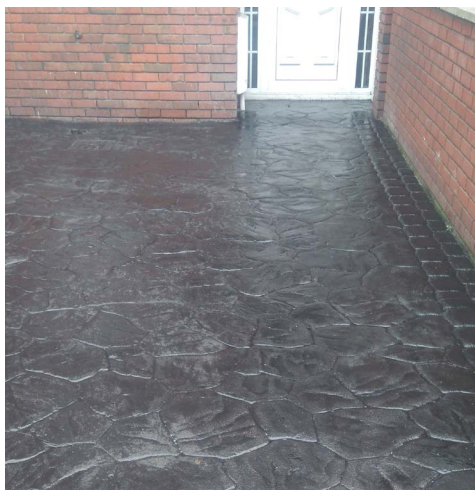
Trwałe odtworzenie na betonie drukowanym.