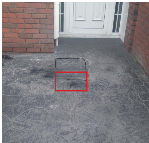
Временное восстановление на печатном бетоне.

«Газовые сети Ирландия» приложит все усилия для того, чтобы не повредить цветочные клумбы и газоны на вашей территории. Вместе с вами мы выберем лучший путь, чтобы избежать повреждения растений, цветов и газонов. Но, возможно, вы предпочтете временно удалить растения или цветы, во избежание ущерба вследствие непредвиденных обстоятельств. Мы с должным вниманием отнесемся к покрытым растительностью участкам, однако, возможно, избежать вытаптывания на лужайке или по краям не удастся, особенно, при плохой погоде. Если в ходе земляных работ пострадают участки, покрытые растительностью, наши сотрудники предпримут все необходимое для восстановления и даже засеют заново, если потребуется. Восстановление цветочных клумб и лужаек может быть отложено в связи с сезонными факторами.