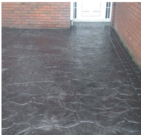
Постоянное восстановление на печатном бетоне.